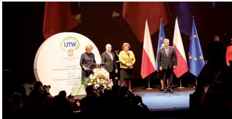
Anna i Bronisław Komorowscy na obchodach 40-lecia UTW