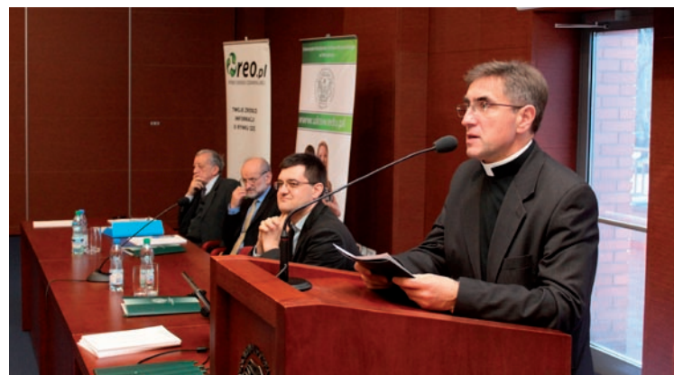
Rektor UKSW podczas otwarcia konferencji poświęconej energetyce