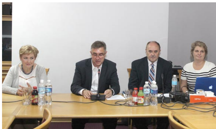
Uczestnicy polsko-amerykańskiego spotkania na UKSW

Strony zadeklarowały zamiar podjęcia współpracy w celu realizacji projektów związanych z rozwojem nieinwazyjnych sensorów medycznych. Lux Med wyraził zainteresowanie udziałem w badaniach klinicznych, natomiast UKSW i Enfoglobe w Liście intencyjnym zapowiedziały m.in. współ-