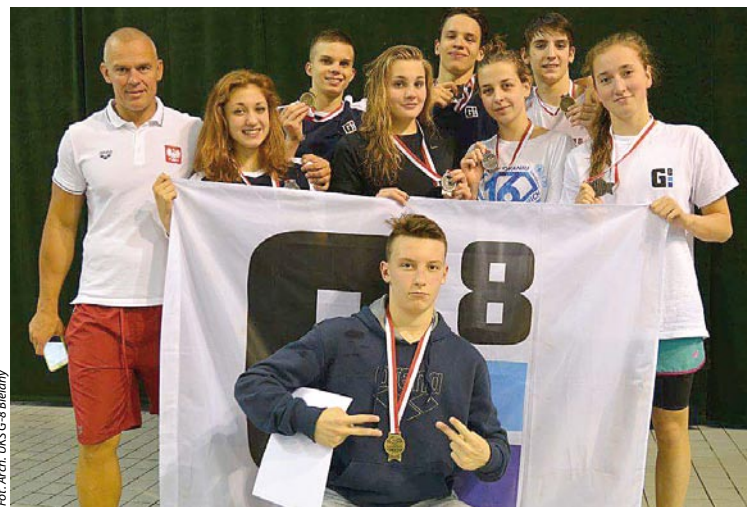
Młodzi pływacy z UKS G-8 Bielany z trenerem

Bieganie nie jest jedyną dyscypliną sportową. Każdy osoba, która biega, powinna dla polepszenia sprawności, oraz swoich wyników zaplanować dodatkowe zajęcia, które obejmą ćwiczenia brzucha, pleców, ramion. Ćwiczenia tych