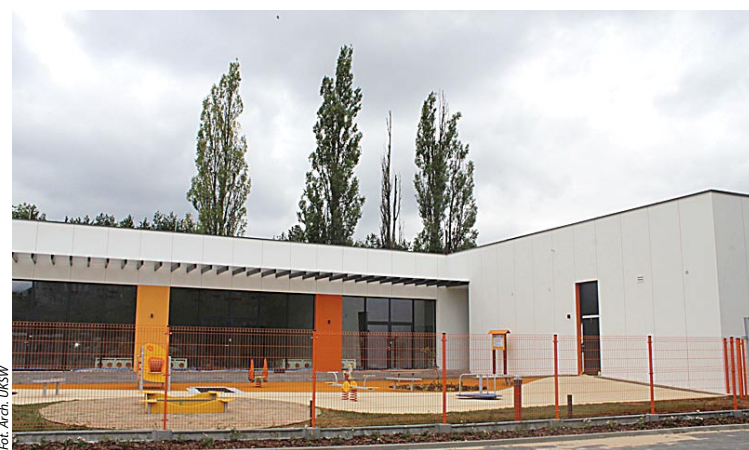
Budynek przedszkola na kampusie na Młocinach