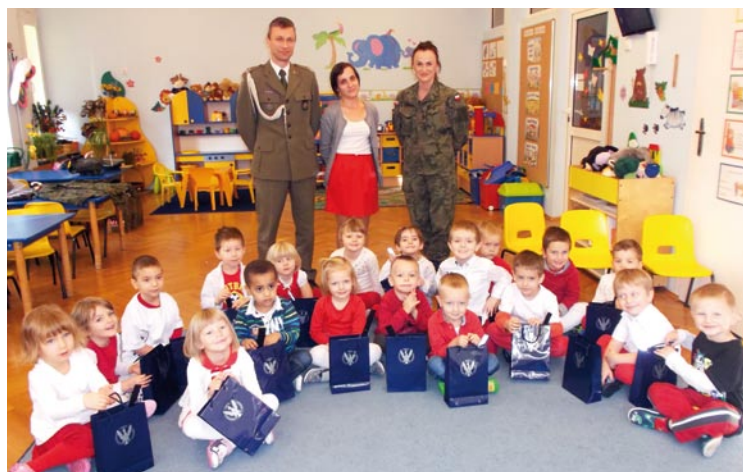
Wspólne zdjęcie przedszkolaków i gości z WKU Śródmieście

Podczas spotkania przedszkolaki miały okazję zobaczyć i przymierzyć mundur wojskowy i ekwipunek żołnierski. Jednak głównym celem wizyty było przybliżenie dzieciom znaczenia symboli narodowych, kształtowanie postaw patriotycznych oraz promowanie szacunku i miłości do ojczyzny, która po 123 latach niewoli odzyskała wolność. Wręczanie żołnierzom samodzielnie wykonanych flag, a także recytacja