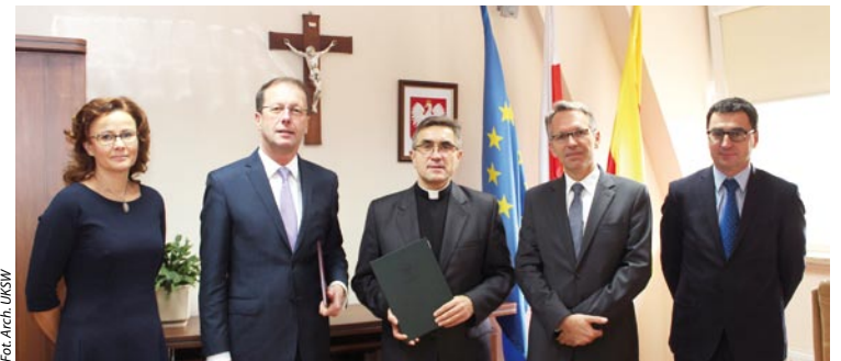
Uczestnicy zawartego porozumienia między UKSW i Instytutem Kardiologii