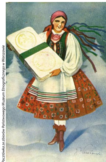
Pocztówka ze zbiorów Państwowego Muzeum Etnograficznego w Warszawie

Wystawa nosi tytuł „Pocztówki archiwalne i gwiazdy kolędnicze z kolekcji Państwowego Muzeum Etnograficznego w Warszawie” i została przygotowana we współpracy Muzeum oraz bielańskiego ratusza. Miejscem, w którym można będzie wystawę oglądać, jest foyer przed salą widowiskową w siedzibie Urzędu Dzielnicy. Na wystawie zobaczymy bożonarodzeniowe pocztówki z początku ubiegłego stulecia oraz fotografie gwiazd kolędniczych z różnych regionów Polski. Pocztówki ukażą nam najróżniejsze świąteczne zwyczaje – ścinanie i ubieranie choinki, łamanie się opłatkiem, wieczrę wigilijną – a wszystko oczywiście w zimowej scenarii. Natomiast zdjęcia gwiazd kolędniczych przypomną nieco już zapomniany świąteczny atrybut – osadzone na stelażu gwiazdy, z którymi od domu do domu chodzili kolędnicy