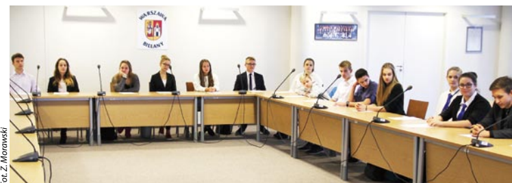
Członkowie Młodzieżowej Rady Bielan