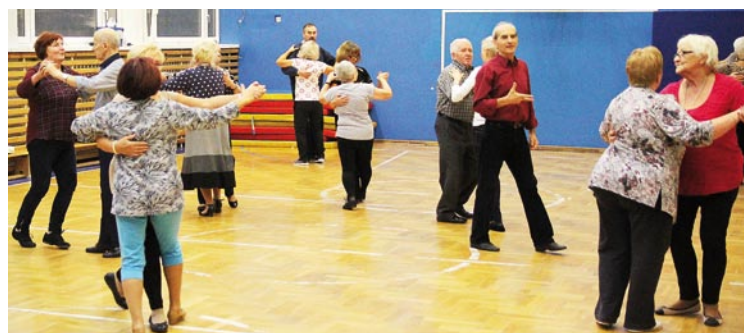
Zajęcia z tańca dla seniorów