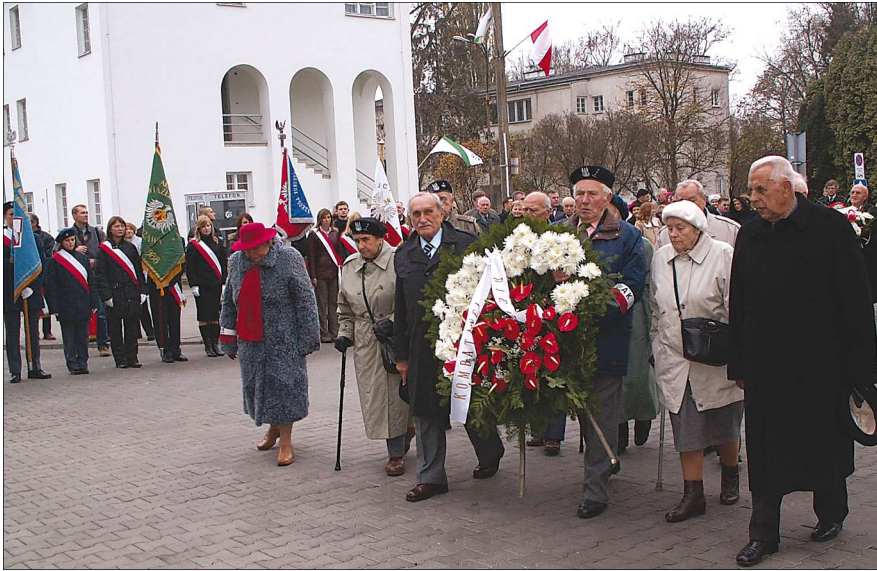
Kombatanci przed pomnikiem Józefa Piłsudskiego

Mówcy zwracali jednak uwagę, że wolność nie była nam dana raz na zawsze. Za-