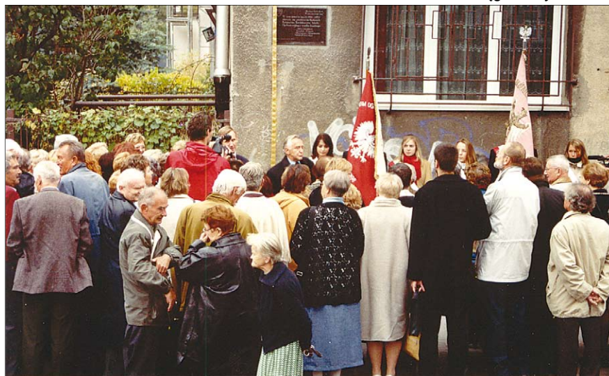
Odsłonięcie tablicy na pierwszym własnym budynku szkolnym przy ul. Barcickiej 2