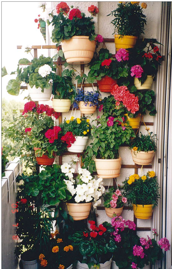
Kwiaty przy ul. Reymonta 23/419

ul. Brązowniczej oraz filii Bielańskiego Ośrodka Kultury przy ul. Estrady. Wiele ogródków znajdujących się przy blokach jest wspólnym osiągnięciem mieszkańców.