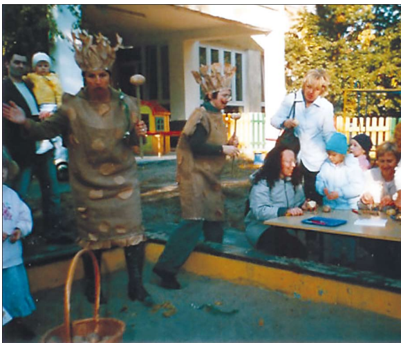
Król i królowa w ziemniaczanym królestwie