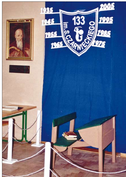
Sala lekcyjna z lat czterdziestych

1991 r. Uczniowie, poprzez profesjonalnie przygotowany program artystyczny, przybliżyli zebranym dzieje szkoły od 1935 r. – czas zwątpienia, rozterek i walki o byt z okresu II wojny światowej, a także chwile radości i sukcesów, których nie brakowało w jej długoletniej historii. Wspaniale do-