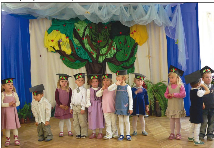
Sala gimnastyczna przypominała ogród

Kolejna część spotkania rozpoczęła się w ogrodzie przedszkolnym paradą poszczególnych grup. Korowód prowadził Pan Pomidor – postać znana wszystkim przedszkolakom. Przy dźwiękach znanych piosenek doskonale bawiły się dzieci, rodzice i wszyscy goście. Były też konkursy i tańce. Ponieważ pogoda tego dnia dopisała, więc zabawa trwała długo. Zaproszeni