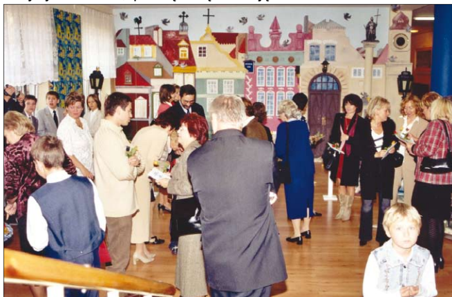
Pierwsze piętro zamieniło się w Starówkę Warszawską...