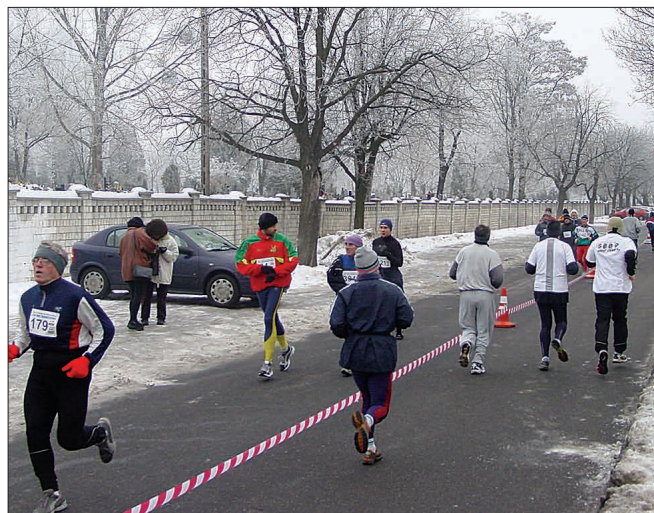
Mimo mrozu w biegach wzięło udział prawie 600 osób