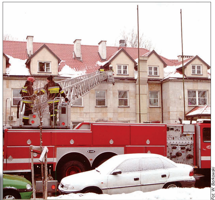
Zima dała się we znaki