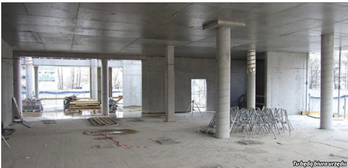
Tu będą biura urzędu