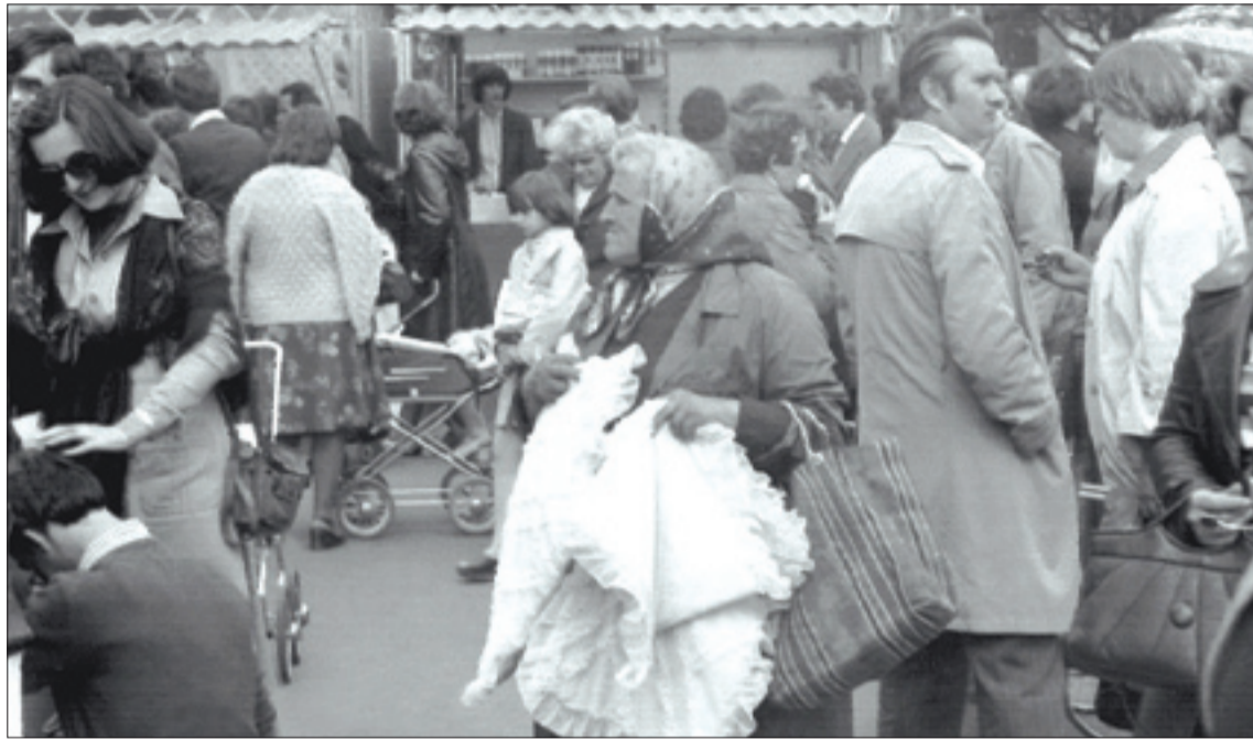
Róg ul. Żeromskiego i Jarzębskiego, kiermasz i giełda rzeczy używanych – maj 1978 r.

Zara „na dzień dobry”, zwał kopii starych PIT-ów ujrzałem, którym obywatelsko oddawał na Skalbmierskiej, niektóre z 10 lat miały albo i więcej. Zostawić? Wyrzucić? Na bok chwilowo jem odsunął. O! Roczники „Naszych Bielany”, jejkę jak ich dużo, aha, sznurek wziął pękl,