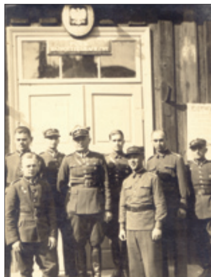
Oficerowie Pułku – lata 30.