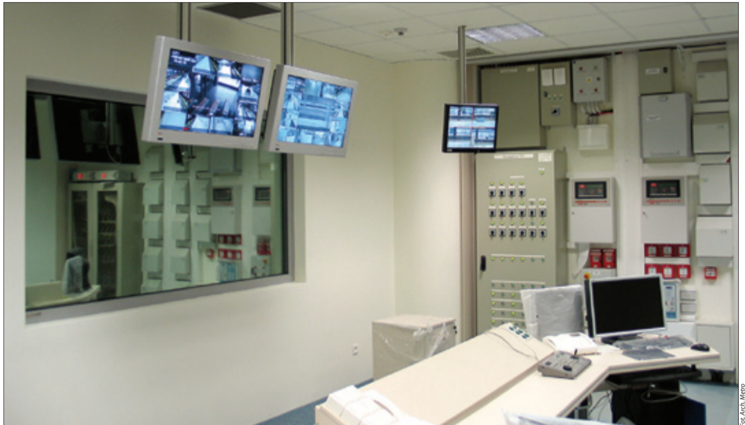
Nowoczesna dyspozytornia na stacji Słodowiec

stać samochód na parkingu Park&Ride, przejść zadaszonym łącznikiem do węzła, gdzie pod dachem zlokalizowana będzie pętla autobusów i tramwajów, wygodnie przesiąść