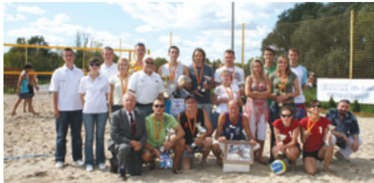
Grupowe zdjęcie po zawodach

30 -31 sierpnia odbyły się dziesiąte, a więc jubileuszowe, Mistrzostwa Warszawy Amatorów w Siatkówce Plaźowej, które zorganizowało Ognisko TKKF „Piaski” Warszawa. Przy lekko deszczowej i wietrznej pogodzie w sobotę, a bardzo pięknej słonecznej pogodzie w niedzielę, Mistrzostwa po raz drugi odbyły się na boiskach plaźowych PJB „Erkam” przy ul. Antoniewskiej 30 na Siekierkach, z udziałem ponad 35 par kobiet, mężczyzn i oldbojów podzielonych na kategorie wiekowe. Patronat medialny nad imprezą objęło „Życie Warszawy”.