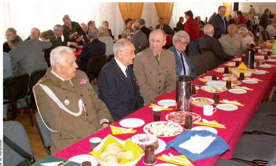
Wielkanoc w Klubie „Chomiczówka”