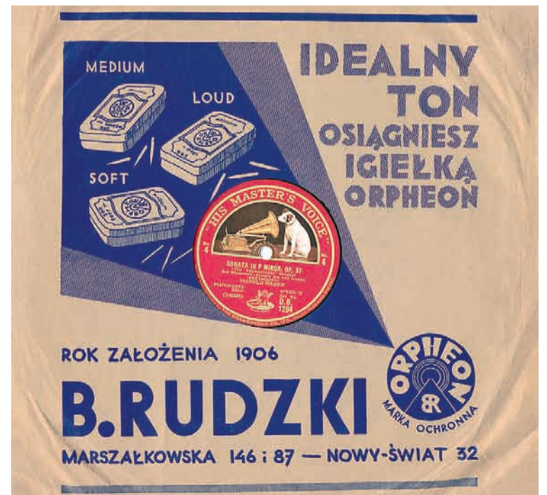
Foto 2. Płyta hmv