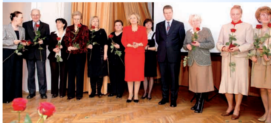
Odznaczeni najlepsi pracownicy zespołu