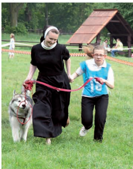
Biegaj razem z psem

Gwarantujemy dzień pełen niezapomnianych wrażeń oraz wspaniałą zabawę dla wszystkich dzieci i ich opiekunów. Szczególnie