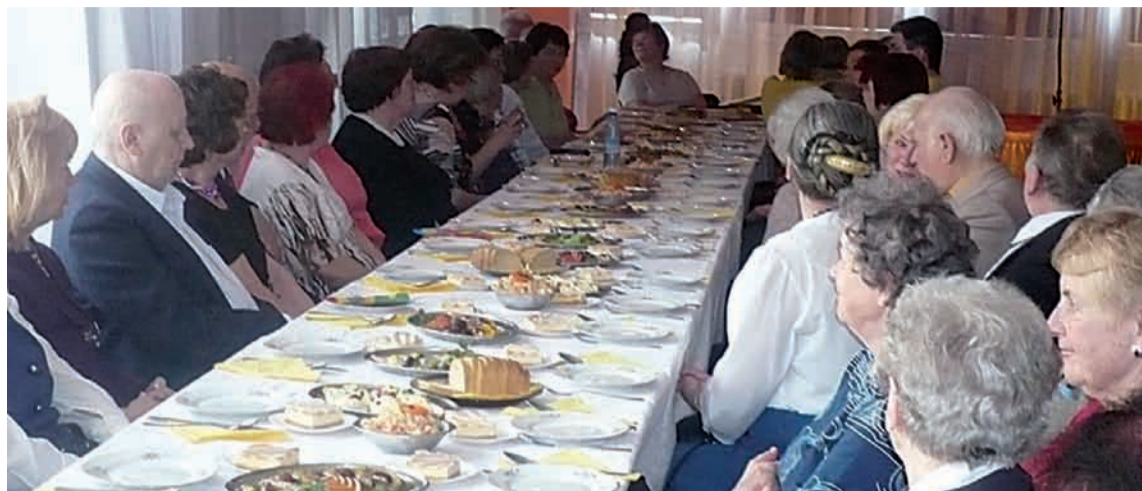
Wielkanoc w Klubie „Domino”