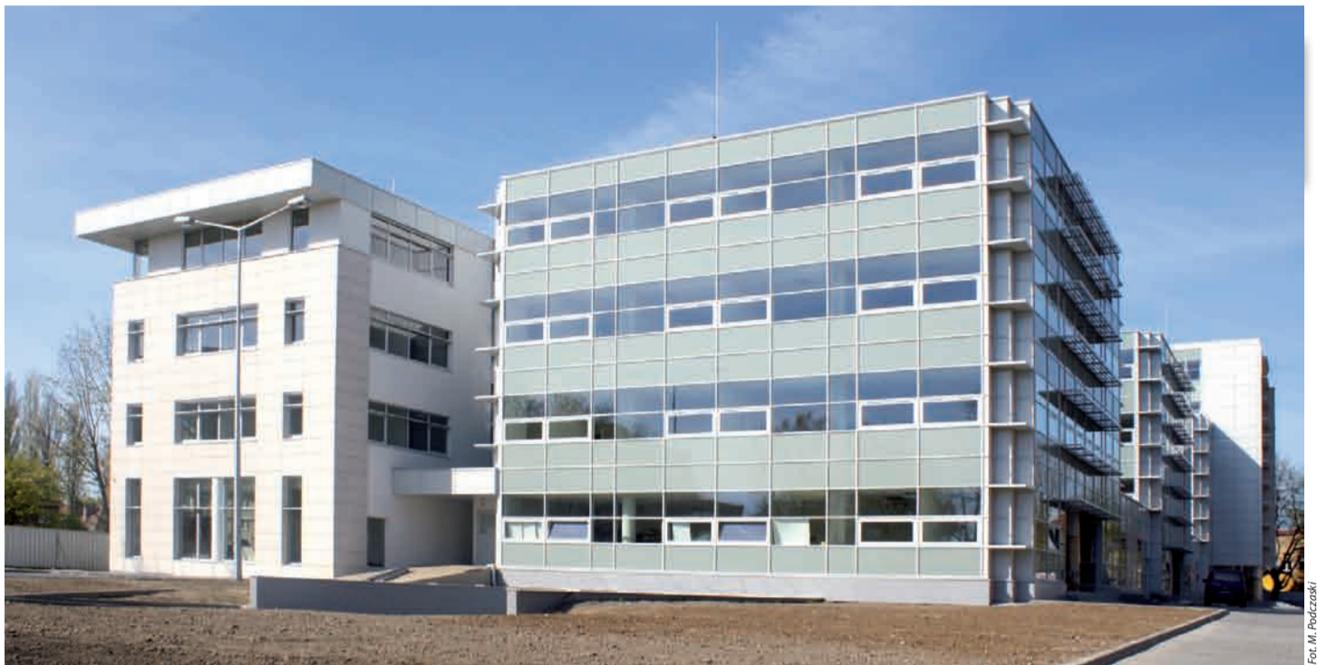
Widok od strony ul. Staffa – kwiecień 2009 r.