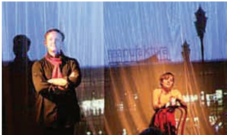
Fragment spektaklu „Ja Borowiecki”

realizacji swego celu, jakim jest własny wielki biznes (fabrykę można tu potraktować metaforycznie). Próba znalezienia odpowiedzi na podstawowe, często dziś pojawiające się pytanie: być czy mieć? Borowiecki, miotany sprzecznymi namiętnościami, bezwzględnie wybiera mieć! Presja sukcesu przesłania wszystko i prowadzi w sposób nieunikniony do psychicznej i moralnej klęski bohatera – osamotnienia i, pomimo spektakularnego sukcesu, poczucia winy i niespełnienia. Spektakl został oparty na wątkach powieści mówiących o najważniejszych kobietach w jego życiu: Ance (narzeczonej), Lucy (kochance) i Madzi (córcie milionera). Jest jeszcze czwarta, najsilniejsza konkurentka: FABRYKA (FIRMA). To ona zwycięża, lecz jest to gorzkie zwycięstwo.