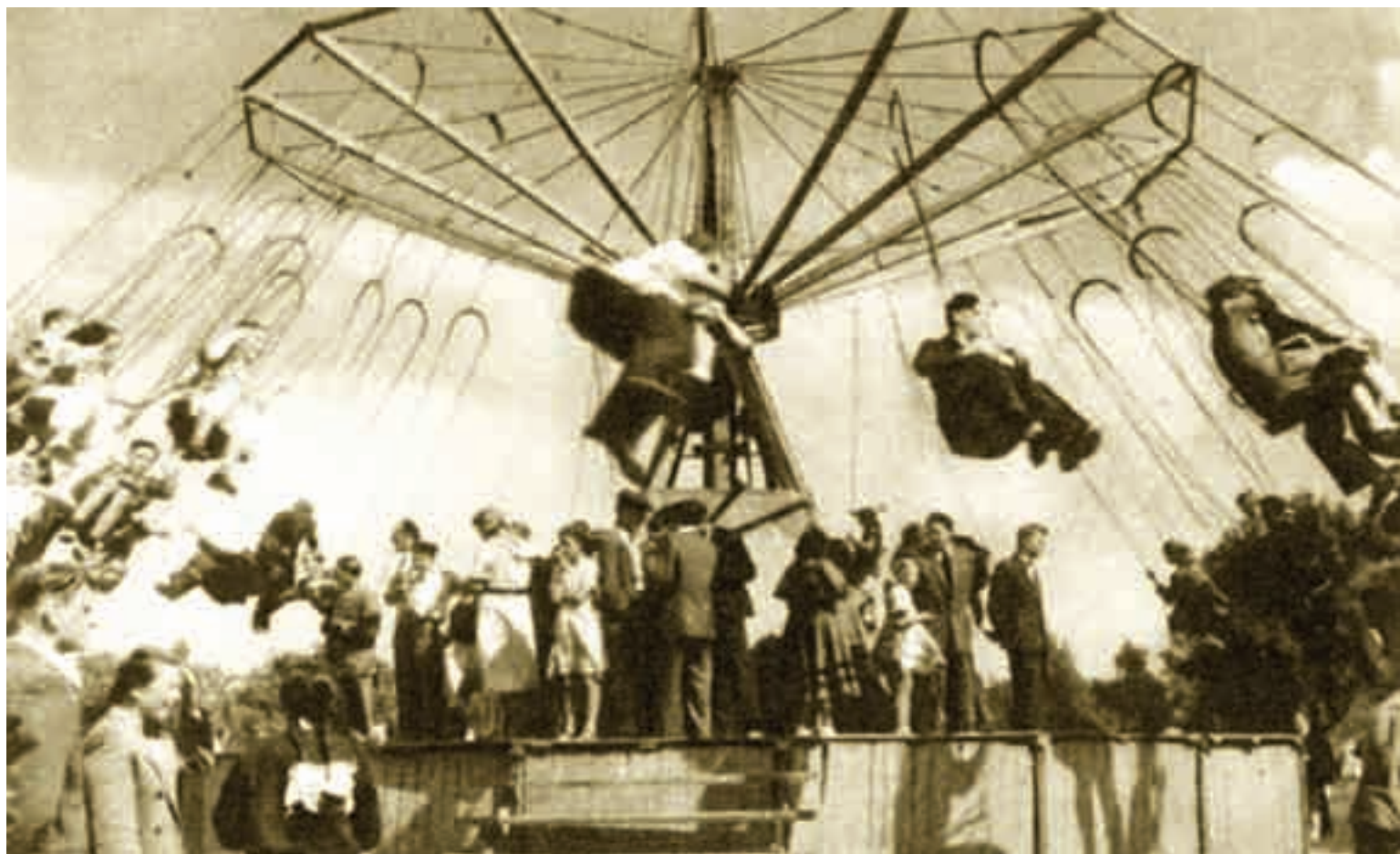
Karuzela na Bielanach – 1951 r.

W niedzielę 14 czerwca w g. 13 – 20.30 na imprezę przy stawach Brustmana zapraszamy szczególnie