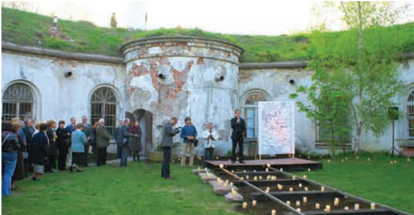
Uroczyste spotkanie przed murami Fortu Sokolnickiego

Uroczystość w Forcie Sokolnickiego w Parku Żeromskiego