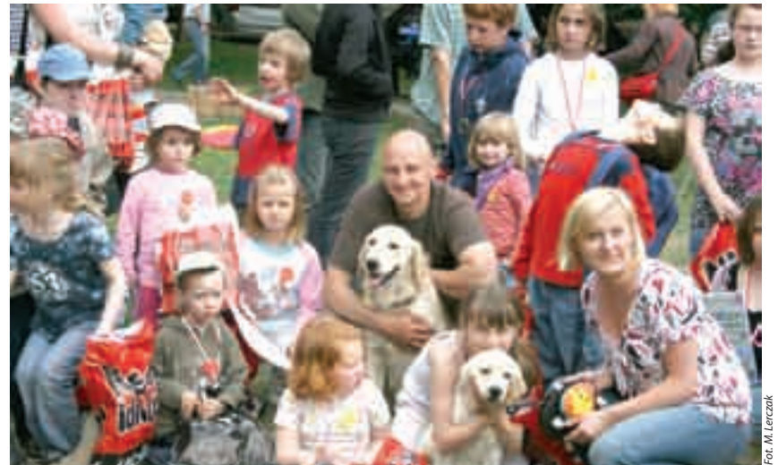
Pamiątkowe zdjęcie uczestników imprezy

Zapraszamy na przeglądy rejestracyjne pojazdów z możliwością telefonicznego ustalenia dogodnego terminu.