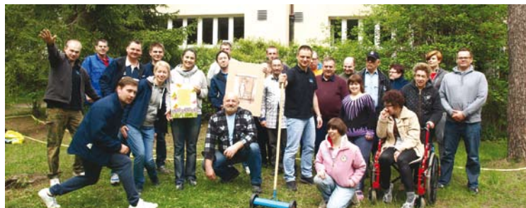
OMRON DAY w BŚDS

oddział OMRON Electronics współpracuje w tym zakresie z Bielańskim Środowiskowym Domem Samopomocy. Wieloletnie doświadczenia wspólnych spotkań w niedostrzegalny sposób przekształciły się w integracyjne spotkania grupy przyjaciół.