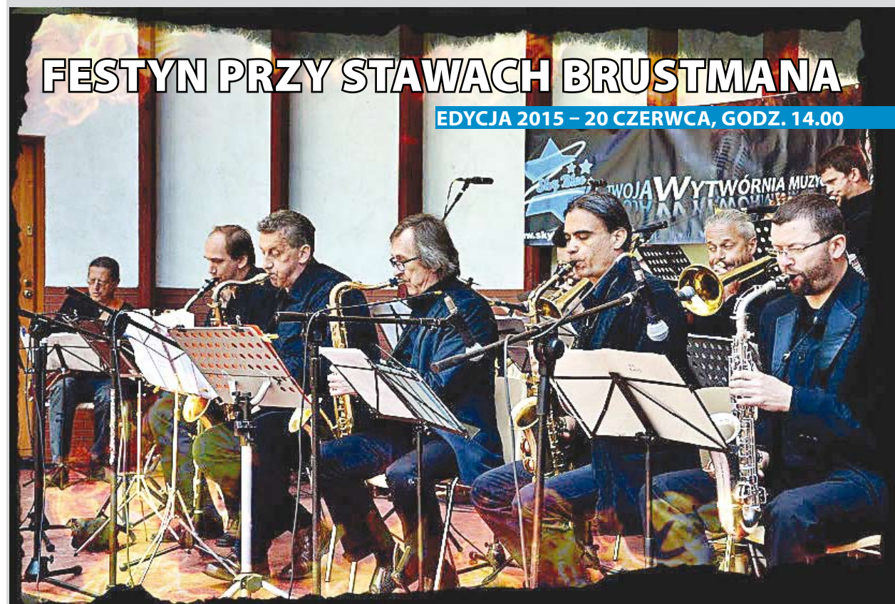
Zespół Sky Band

Organizatorzy Pikniku: Bielański Ośrodek Kultury, Urząd Dzielnicy Bielany m.st. Warszawy, Warszawska Spółdzielnia Mieszkaniowa - Administracja Osiedla „Wawrzyszew”, Rada Osiedla Wawrzyszew, Samorząd Mieszkańców osiedla Wawrzyszew. Czekamy na Państwa. Pogoda zamówiona.