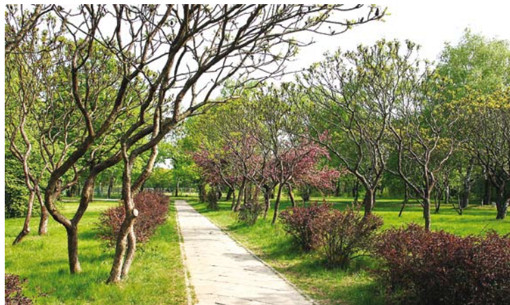
Aleje spacerowe na terenie AWF Warszawa