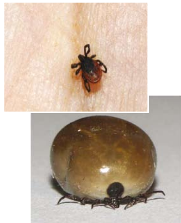
Kleszcz: przed ugryzieniem i po

W Polsce występuje kilka gatunków kleszczy, jednak najbardziej rozpowszechniony jest kleszcz pospolity ( Ixodes ricinus ). Każde stadium rozwojowe kleszcza tzn. larwa, nimfa oraz forma dojrzała musi raz wysać krew od kręgowca aby móc dalej się rozwijać. Cykl rozwojowy jednego pokolenia kleszczy trwa średnio 2 lata. Wzrost ich aktywności zależy od czynników klimatycznych i przebiega w dwóch fazach: w maju/czerwcu i we wrześniu/październiku. Wilgotne lato i łagodna zima sprzyjają rozprzestrzenianiu