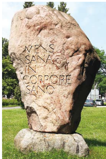
W zdrowym ciele zdrowy duch

Obecna stojąca rzeźba odłana w brązie to powiększona przez autora wersja pierwotnej statuetki. Naprzeciw „Chłopiec z piłką”, rzeźba autorstwa Andrzeja Janczuro, ukraińskiego artysty ze Lwowa odsłonięta w 1999 r. Po prawej stronie, trochę odsunięte od Alei Główny, znajduje się osiedle mieszkaniowe dla pracowników naukowych Uczelni i akademiki. Mijając krytą pływalnię, wybudowaną w 1936 r., przytulonej do wysokiej i smukłej, dawnej wieży ciśnienia, dochodzimy do Gmachu Głównego. Z tego miejsca możemy podziwiać modernistyczne cechy architektury zabudowań. Płaskie dachy z tarasami, szerokie okna,