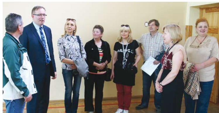
Spotkanie w SP Nr 209