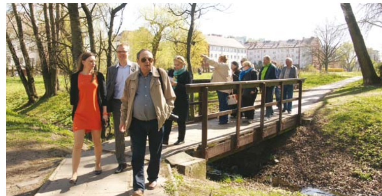
Wizja lokalna na Wawrzyszewie