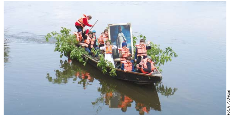
Do brzegu zbliża się tratwa z obrazem św. Brunona