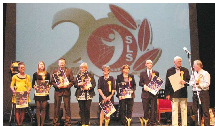
Wyróżnieni podczas gali