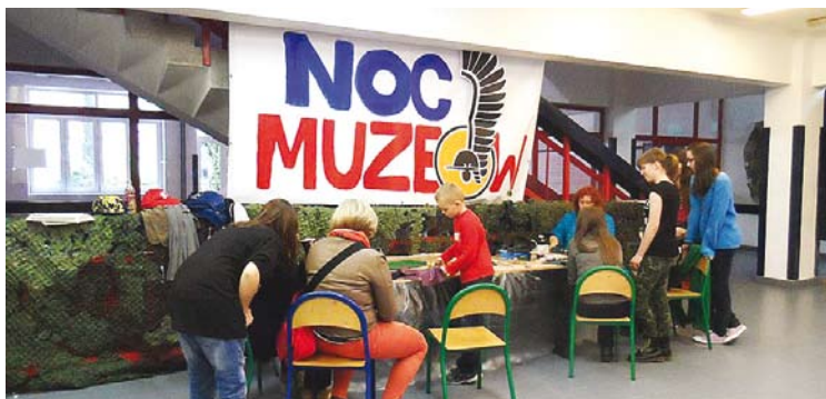
... w „Maczku”