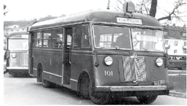
Autobus, chevrolet efd 183