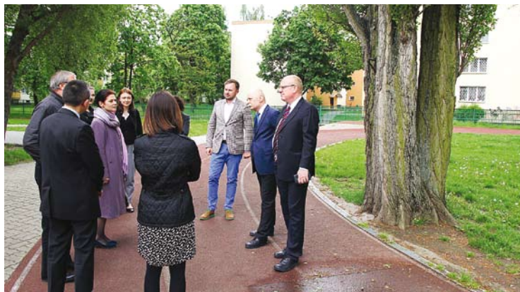
Przedstawiciele MBOiR, MŚ i NFOŚiGW na terenie ZS Nr 56

Wszystkie prace wykonane w ramach konkursu „System Zielonych Inwestycji” muszą spełniać wymogi stawiane przez Bank Światowy i nie mogą mieć negatywnego wpływu na środowisko naturalne. Termomodernizacje wykonane w bielańskich placów-