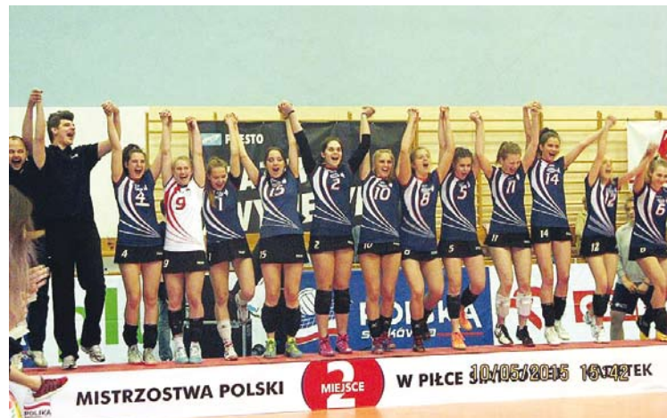
Zawodniczki MUKS Sparta Warszawa na podium...

Młode zawodniczki, nazywane pieszczotliwie – najpierw przez trenera, później już przez wszystkich sympatyków – „Bieląskimi Bandziorami”, przebrnęły przez turnieje: ćwierćfinałowy (w Nowym Sączu), półfinałowy (w Le-