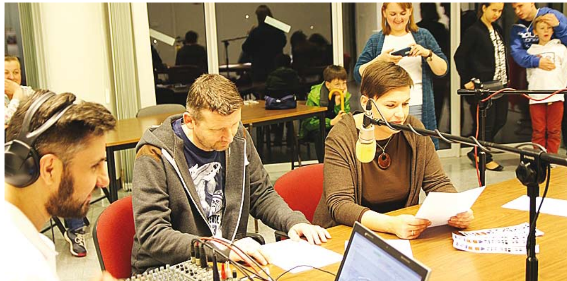
Noc Muzeów ... w Radio KiS

Najwcześniej, bo już o godz. 18:00 wystartowała Noc Muzeów w „Maczku”, czyli w budynku ZS Nr 55 przy ul. Gwiaździstej 35. Goście, którzy odwiedzili szkołę mieli okazję zobaczyć ekspozycję muzealną, poświęconą tematyce II wojny światowej oraz I Polskiej dywizji Pancerniej, jak również skosztować przepysznych smaczków w kawiarence historycznej.