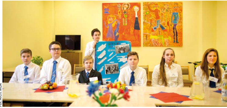
Uczniowie ZS nr 124 przedstawiają swoje osiągnięcia