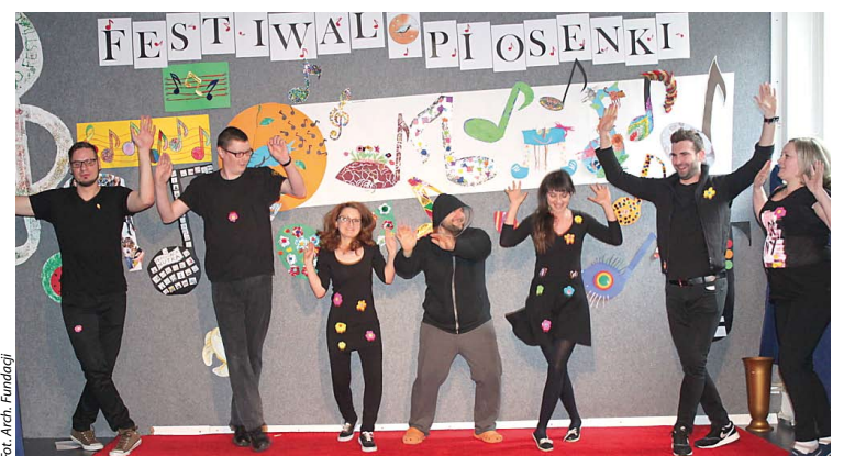
Fort. Arch. Fundacji