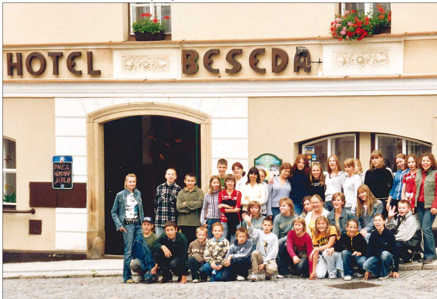
Nasza grupa przed hotelem

W Chełmsku Śląskim zwiedzaliśmy kompleks chatup tkackich: 12 domków