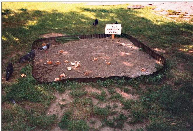
Karmnik przy ul. Przyńskiego

ślimy o własnym kraju w sposób niemal encyklopedyczny, jakby nieco uproszczony. W rzeczywistości rzecz jest o wiele szersza, poważniejsza, z wieloma kontekstami w tle, co zaraz postaram się udowodnić.