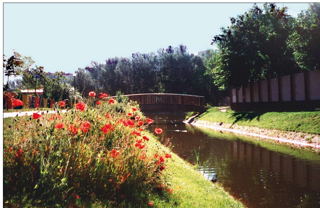
Maki na Wawrzyszewie

kańcy, sprawujący opiekę nad bielańskimi kapliczkami, a tych naprawdę nie brakuje.