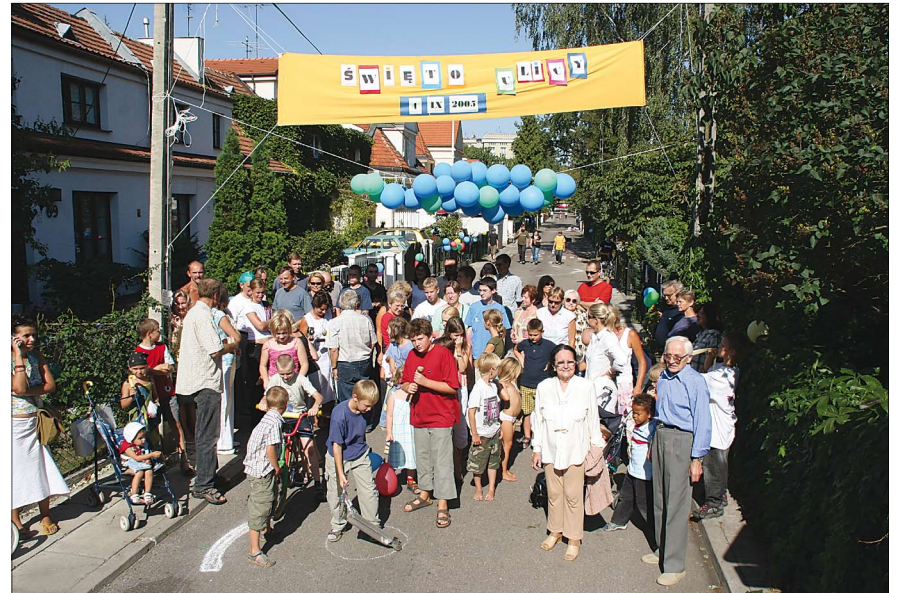
Festyn na ulicy

W niedzielę 4 września mieszkańcy ulicy Kleczewskiej na Starych Bielanych (odcinek przy Kasprowicza) zorganizowali festyn uliczny pod hasłem „Poznajmy się lepiej”.