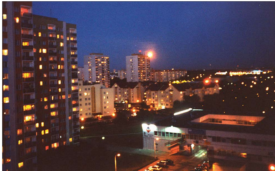
Księżyc nad Bielaniem

mieszczona obok fotografia. Lecz tym razem, ten Księżyc świeci tylko dla nas. Zostańmy więc jeszcze na chwilę przy artystycznych klimatach. Ponad 30 lat temu Jarema Stępowski śpiewał Stątek do Młocin oraz Jadziem na Bielany. Teraz Sidney Polak (perkusista T. Love) w rytmie