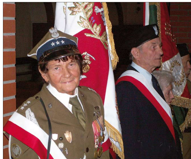
Poczty sztandarowe kombatantów

Apelem poległych i złożeniem pod pomnikiem kwiatów przez liczne delegacje zakończyła się bielańska uroczystość upamiętniająca bohaterów sprzed 66 laty.