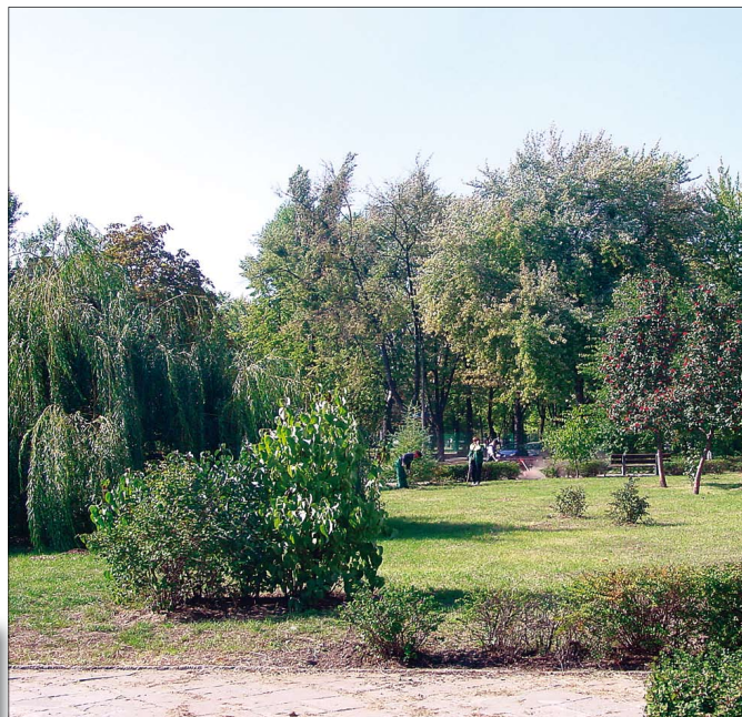
Już jesień... jeszcze nie złota – ul. E. Schroegera