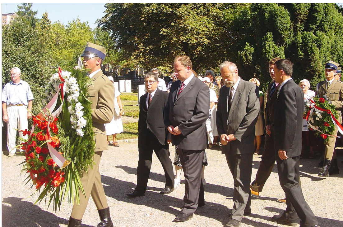
Przed pomnikiem 30. Pułku Strzelców Kaniowskich

powstanie „Solidarności” i zapoczątkowane wtedy zmiany doprowadziły do powstania prawdziwie wolnej i suwerennej Polski.