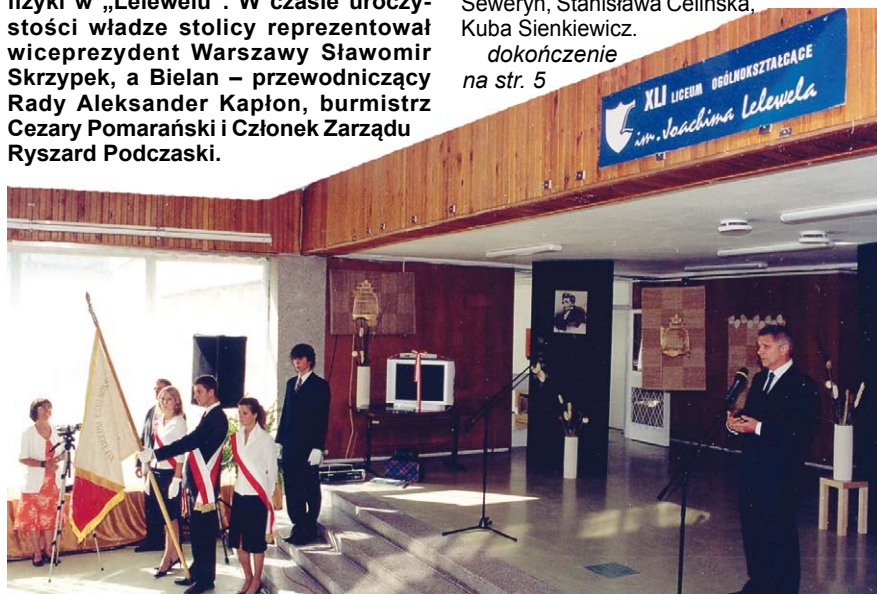
Inauguracja roku szkolnego w XLI LO im. Lelewela