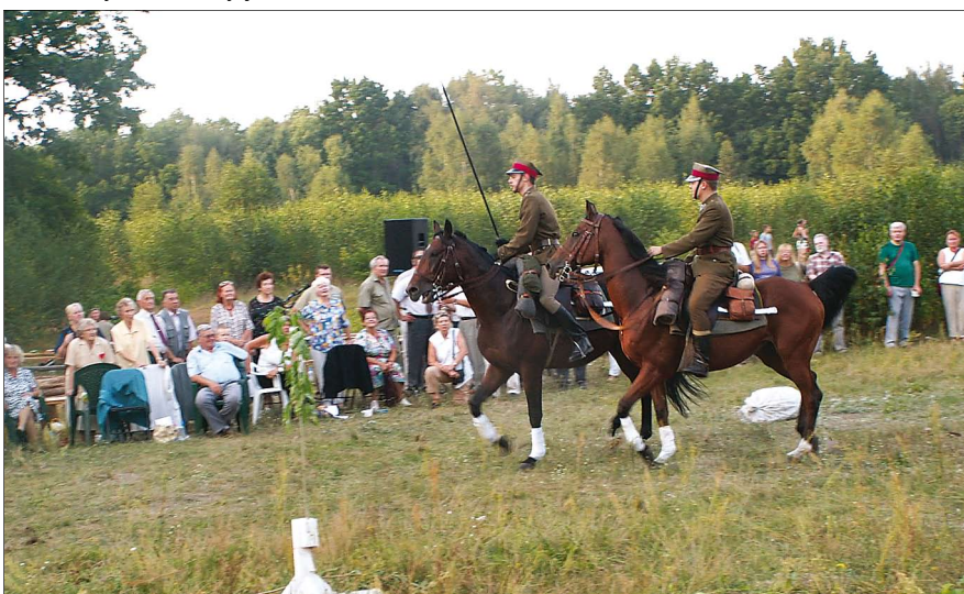
Kawaleria w akcji