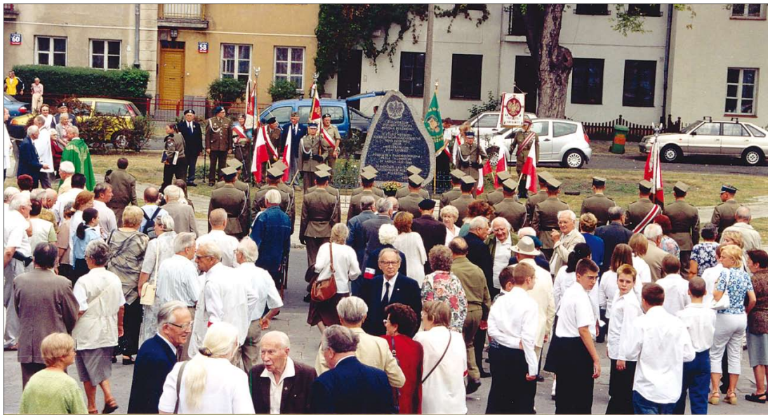
Uroczystość na placu Konfederacji

kich, w łagrach sowieckich, w więzieniach Gestapo, NKWD i UB w latach 1939 – 1956,