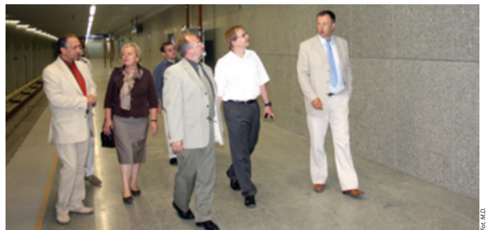
Władze dzielnicy w towarzystwie budowniczych metra oglądają wawrzyszewską stację

I właśnie na bezpieczeństwo pasażerów kładziemy szczególny nacisk w trakcie przygotowania stacji do eksploatacji.