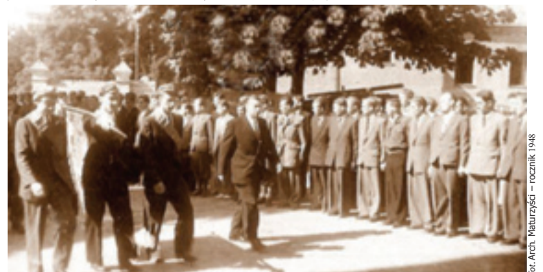
Matura 1948 r. Liceum XX Marianów na Bielanych