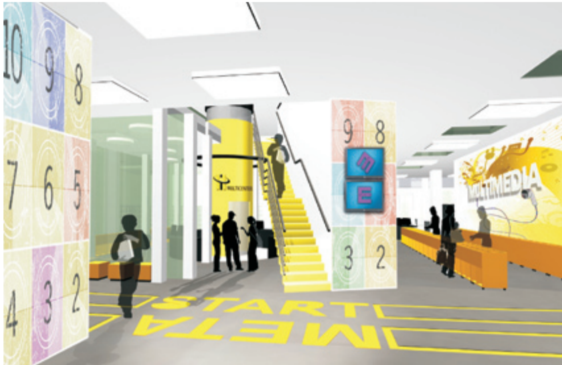
Strefa wejściowa do mediateki

Mediateka będzie miejscem, gdzie młodzi ludzie będą mogli zacząć przygodę nie tylko z książką, ale także z multimediami, a dzięki interaktywnemu centrum edukacji MultiCentrum, skończy się wszechogarniająca nuda, która pojawia się po zakończeniu zajęć szkolnych. Mediateka ma wyzwolić w młodych ludziach ukryte talenty, dać możliwość rozwoju zainteresowań i pasji, a to wszystko dzięki nowoczesnemu wyposażeniu oraz profesjonalnemu personelowi. To, co wyróżni mediatekę na tle innych placówek Bibliotek Publicznych, to przede wszystkim atrakcyjne, nieco futurystyczne, przestronne wnętrza, które od początku zostało zaprojektowane z myślą o książce, multimediami oraz czytelnikach. Mediateka ma stać się platformą wyróżniającą i promującą twór-