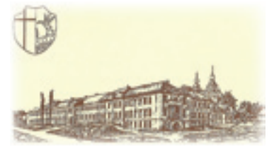
Kolegium XX Marianów na Bielanych

Po mszy św. zaproszeni zostaliśmy przez dyrektora Archidiecezjalnego Męskiego Liceum Ogólnokształcącego, mieszczącego się w nowych budynkach powstałych na miejscu naszej dawnej szkoły. Liceum to, przez swoją lokalizację, jest w pewnym sensie kontynuato-