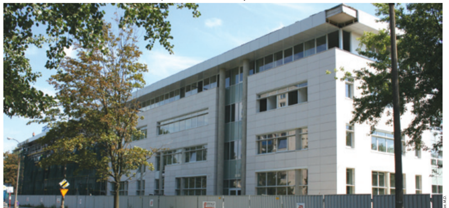
Elewacja budynku ratusza od strony ul. Jarzębskiego – połowa sierpnia 2008 r.

W okresie od lipca do września br. głównym zadaniem stojącym przed generalnym wykonawcą, firmą Eiffage Budownictwo Mitex SA, będzie wykonanie fasady budynku. W tym czasie rozpocznie się również montaż wind, układanie gresów i glazur na ścianach, a także wszelkie prace związane z rozbudową infrastruktury zewnętrznej (parkingi, drogi dojazdowe).