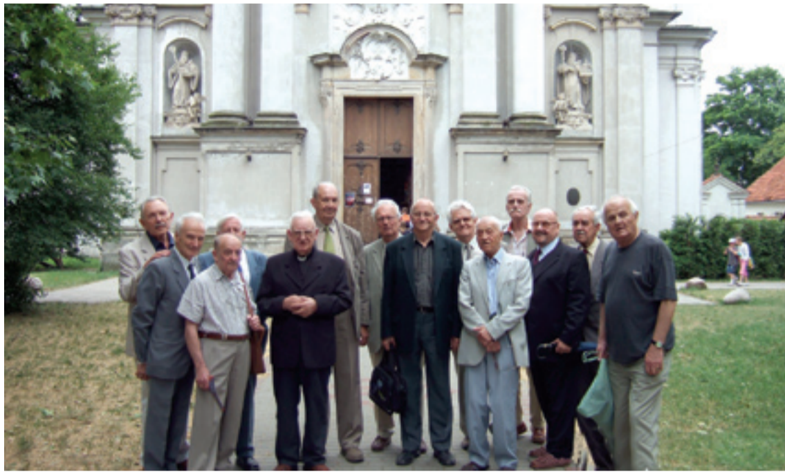
Maturzyści po 60 latach