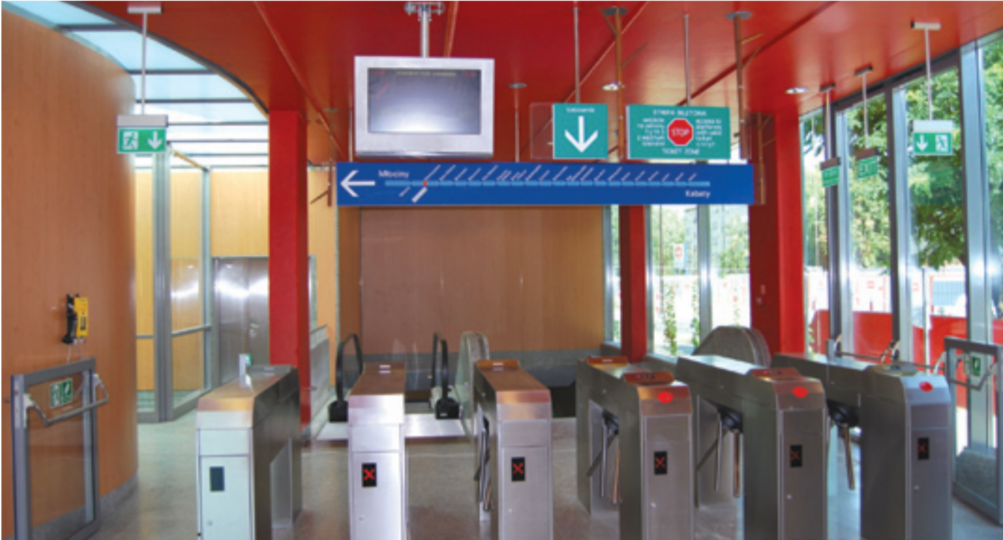
Wejście na peron stacji Wawrzyszew