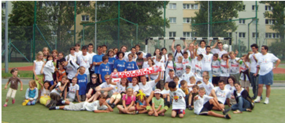
Wspólna fotografia uczestników „Dialogu międzykulturowego poprzez muzykę i sport”

Uczniowie uczestniczyli w zajęciach rekreacyjno-sportowych.