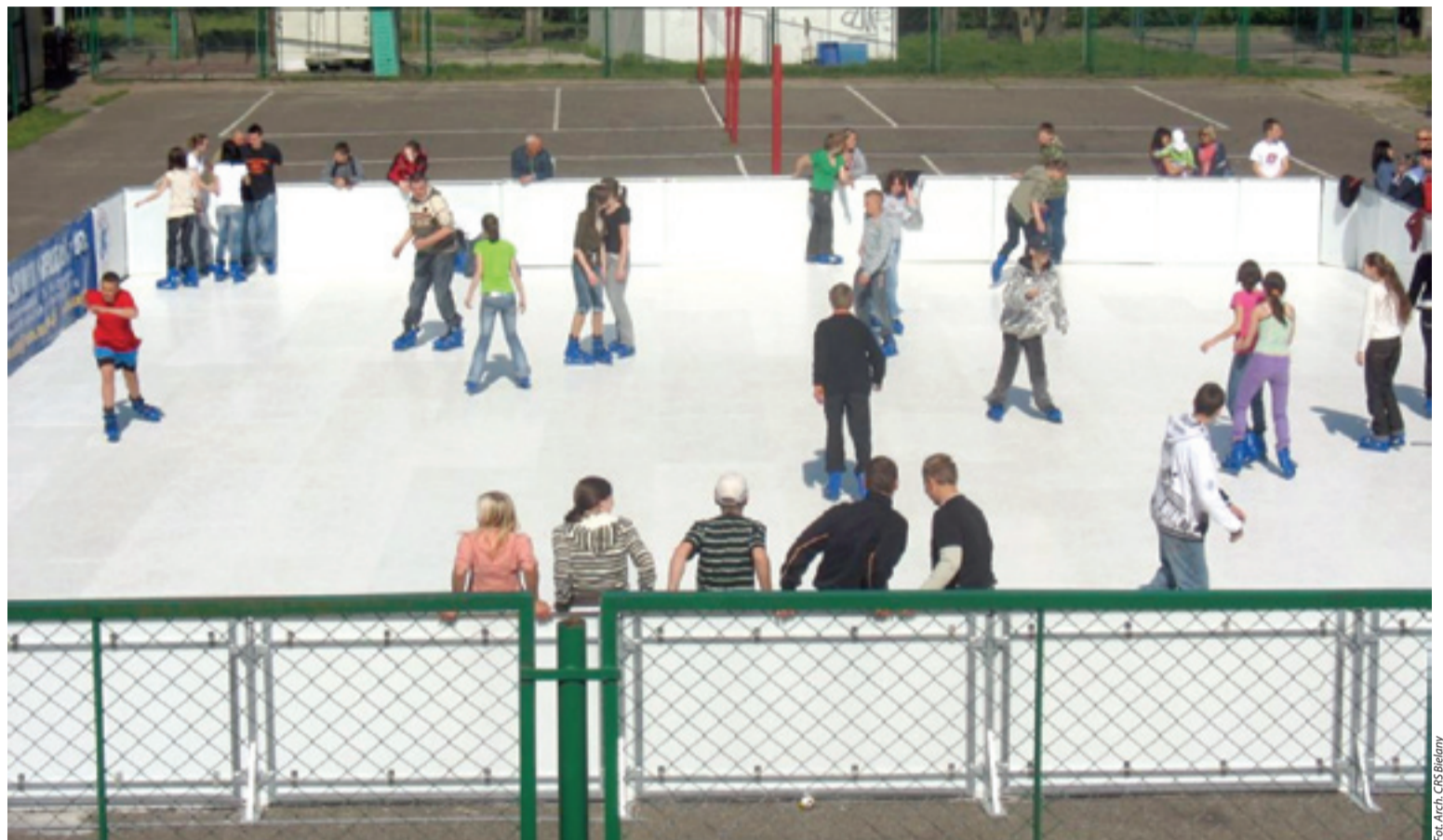
Tak wygląda latem lodowisko

Jesteśmy przekonani, że lodowisko będzie doskonałym sposobem na spędzanie wolnego czasu dla dzieci i dorosłych, tym bardziej, że syntetyczne lodowisko jest obecnie jedynym tego typu obiektem w Warszawie. Biorąc pod uwagę liczbę wielbicieli jazdy na łyżwach, lodowisko będzie na pewno atrakcją rekreacyjną nie tylko dla mieszkańców Bielany.