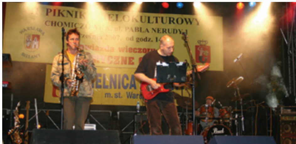
Występ zespołu „Elektryczne gitary” podczas ubiegłorocznego Pikniku

Wielkim wydarzeniem muzycznym – również w kościele św. Zygmunta – będzie z całą pewnością koncert finałowy Festiwalu Sinfonia Varsovia Swojemu Miastu, jaki w dn. 1-14.09. odbywa się w różnych miejscach koncertowych