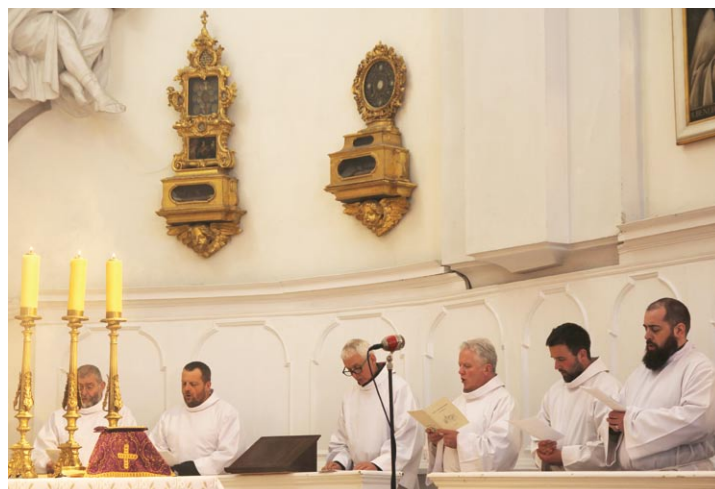
Bornus Consort w kościele pokamedulskim

Bornus Consort to pierwszy zespół wokalny w Polsce, który podjął się przed laty próby rekonstrukcji dawnego brzmienia w możliwie historycznie wiernym kształcie i przy użyciu dawnych technik śpiewu. Zespół dał setki koncertów i spektakli na całym świecie, zrealizował wiele nagrań. Specjalizuje się w tradycyjnym śpiewie jednogłosowym, w tym głównie w chorale gregoriańskim.