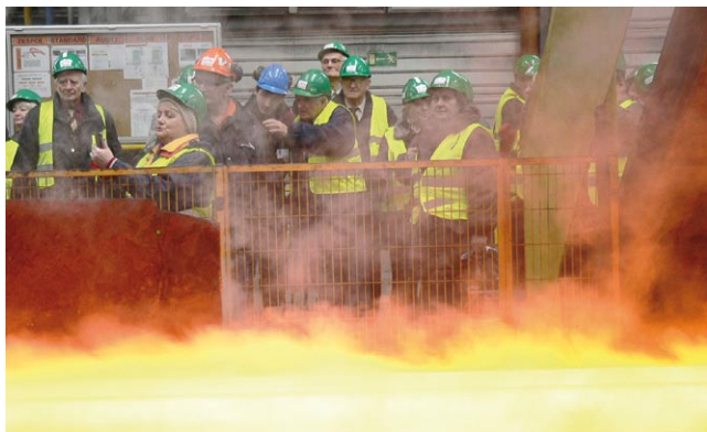
Kombatanci i seniorzy zwiedzają walcownię