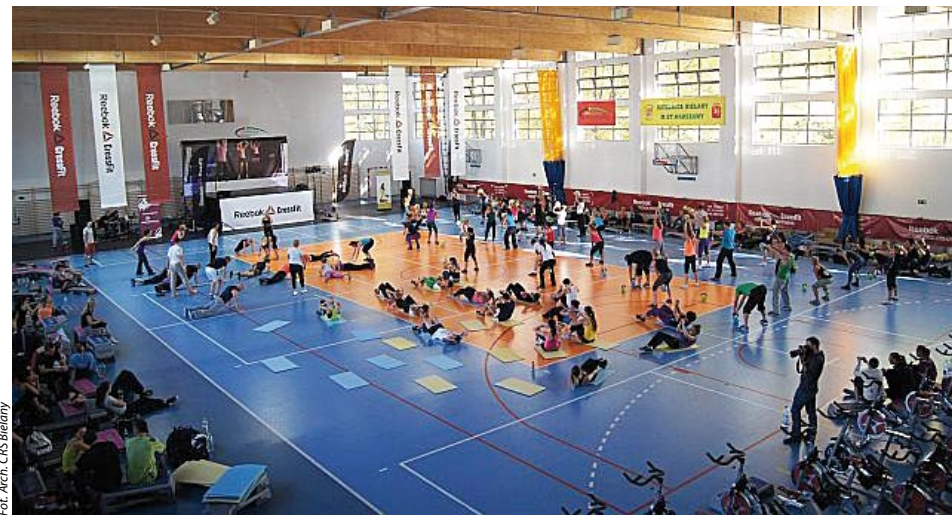
Hala przy ul. Lindego 20