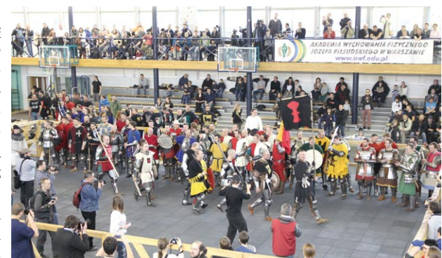
Barwne zbroje podziwiło wiele osób

Spoleczna Szkoła Muzyczna I stopnia im. Witolda Lutosławskiego ul. J. Conrada 6, 01-922 Warszawa