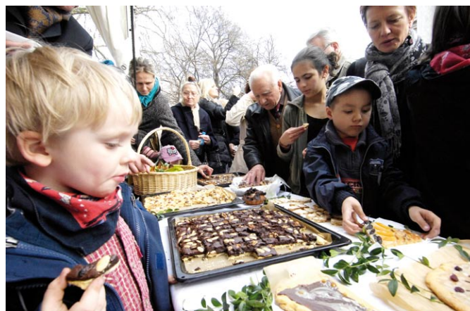
Mazurki w poprzednich latach szybko znikaly ze stolow

Zapowiada się wyjątkowa zabawa, na którą serdecznie zapraszamy wszystkich