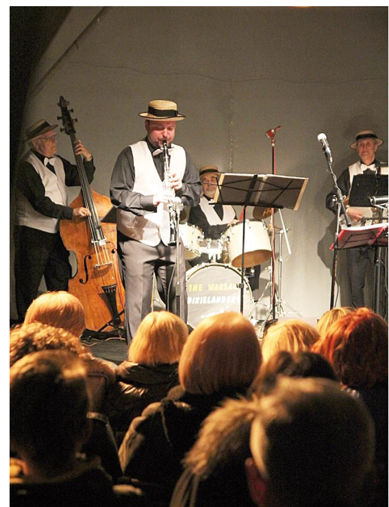
The Warsaw Dixielanders