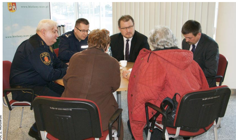
Mieszkańcy Bielan przedstawiają swoje sprawy